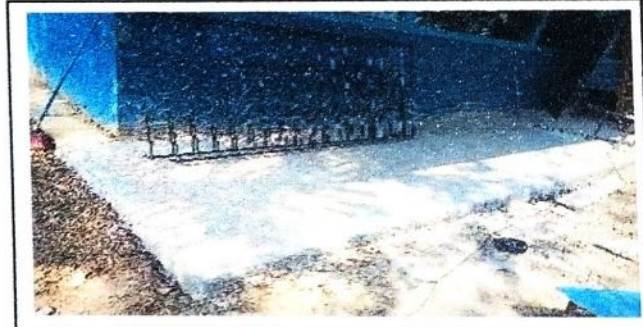
Foto 4: REMODELACION DE PISO TORTA DE CEMENTO A PISO DE GRANITO DEL CORREDOR.