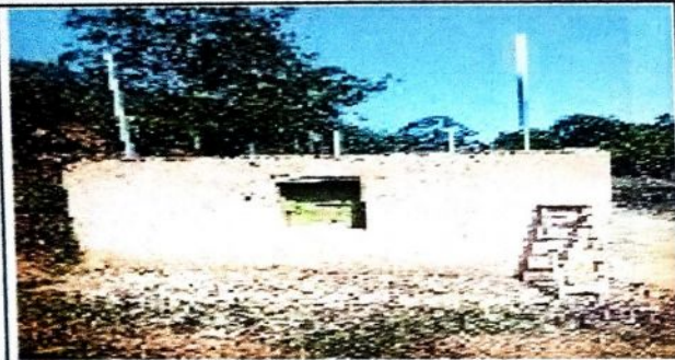
Foto 1: SUSTITUCION DE ENTECHADO, LAMINAS, VENTANAS Y COLOCACION DE BALCONES.