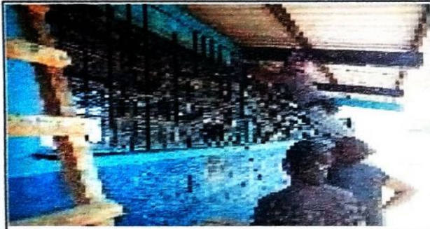
Foto 3: CABIO DE PINTURA INTERNO Y EXTERNO, COLOCACION DE BALCONES, SUSTITUCION DE VIDRIOS, SUSTITUCION DE PISO DE TORTA DE CEMENTO A PISO GRANITO.